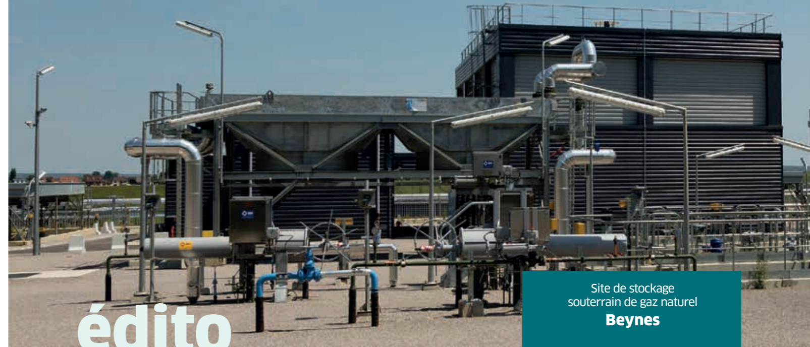
Site de stockage souterrain de gaz naturel Beynes